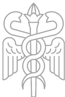
Kwansei Gakuin University School of Business Administration