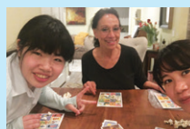
ホームステイで多種多様なアメリカの家庭を体験し異文化に触れる！

●B 課題解決型コース： インターンシップ開始後も合同ビジネス研修と同じホテルに滞在。参加者同士一緒にホテルに滞在するので、終業後も企画提案のための活動を行うことが可能。 ※ホテル滞在中について詳細は、別書類「プログラム同意書」を追ってお渡し致します。