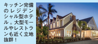
キッチン完備のレジデンシャル型ホテル。大型モジュールやレストランも近く立地抜群！