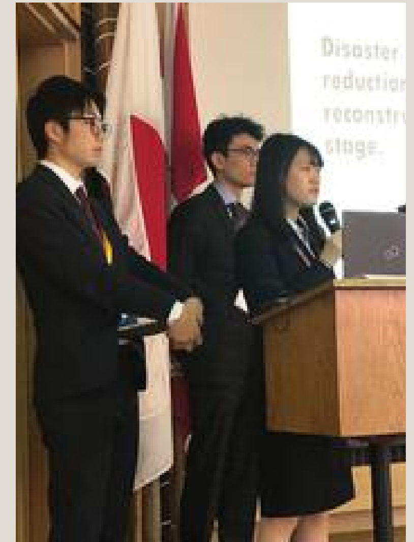
プレゼンテーション

今年度のフォーラムの主催校 城西国際大学の教員や、テーマに 関する専門家の講義を予定