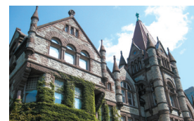
トロント大学 University of Toronto