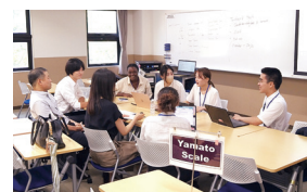
Global Career Seminarで企業担当者から情報収集