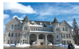
クイーンズ大学 Queen's University

ダイバーシティ豊かな質の高い教育・研究で、カナダ国内はもちろん世界的にも高く評価されている。