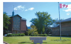
マウント・アリソン大学 Mount Allison University