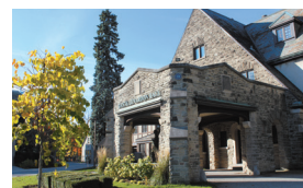
ウエスタン/キングズ大学 King's University College at Western University

きめ細やかな少人数教育により、カナダ国内や海外から評価されている小規模リベラルアーツ大学。